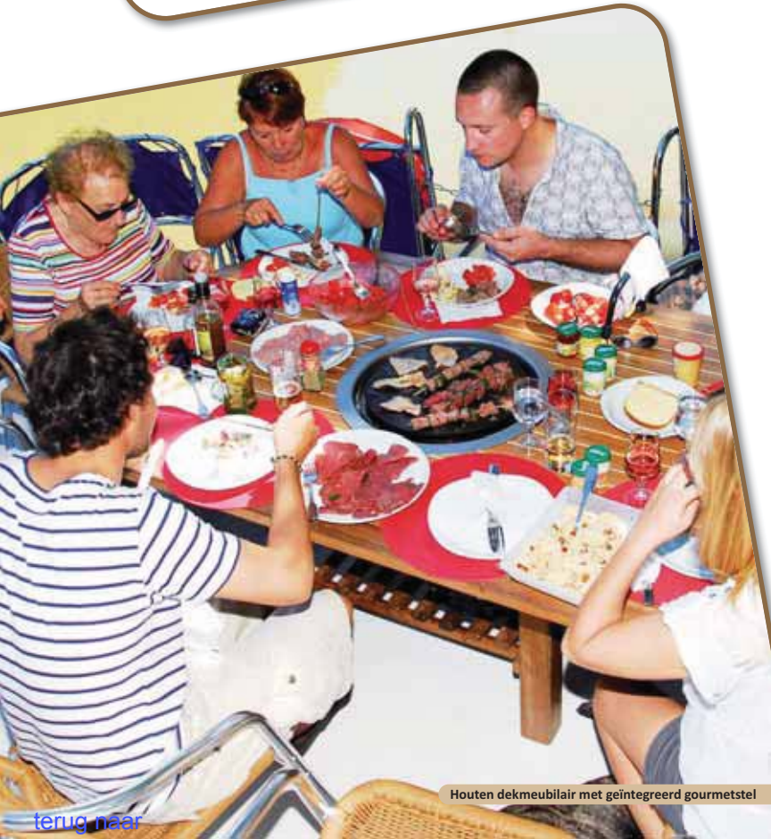
Houten dekmeubilair met geïntegreerd gourmetstel