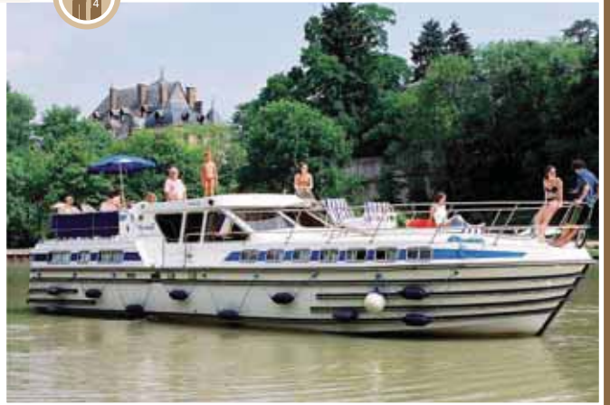
Bourgogne, Het zuiden