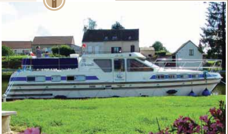
Bourgogne, Het zuiden, Duitsland