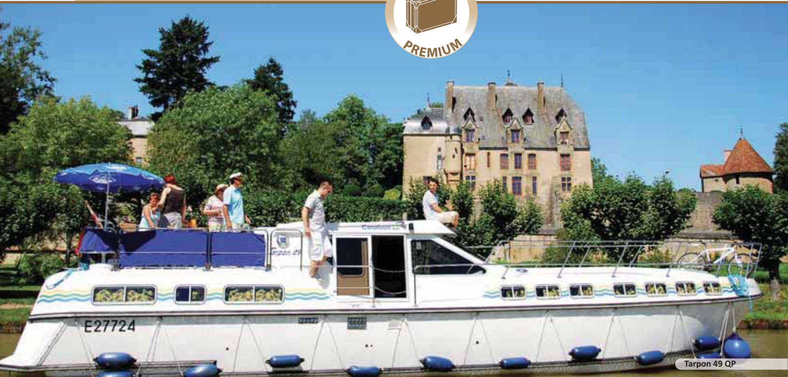
Tarpon 49 QP