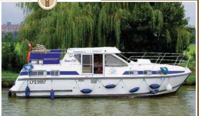
Bourgogne, Het zuiden, België, Duitsland